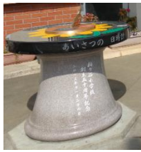
あいさつの日時計